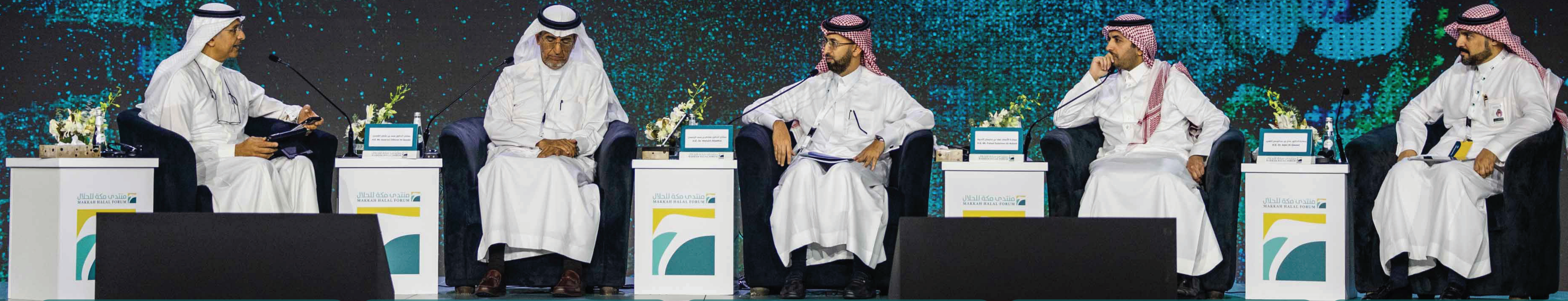
الدكتور بندر عرب مقدم برامج تلفزيونية ومحاور