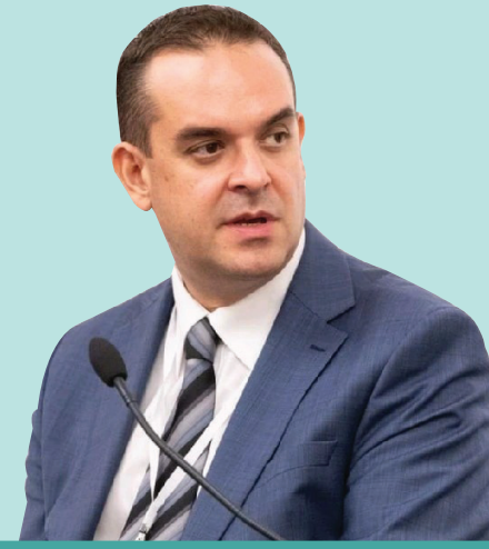
سعادة السيد دينو سيليموفيتش المستشار لوزير خارجية البوسنة والهرسك.

"منتدى مكة للحلال هو وجهة أساسية لقادة الصناعة لاستكشاف حلول تمويل مبتكرة تدفع نمو صناعة الحلال عالمياً وللتعاون مع أصحاب الأعمال والقادة والمبتكرين ذوي التفكير المماثل."