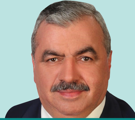
سعادة السيد إحسان أوفت الأمين العام لمعهد المواصفات والمقاييس لدول الإسلامية (SMIIC)

"منتدى مكة للحلال قام بتغيير قواعد الحلال فهو يرفع التعاون والابتكار والممارسات المستدامة التي تساهم في تشكيل مستقبلها."