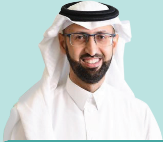
معالي الدكتور هشام الجضعي الرئيس التنفيذي للهيئة العامة للغذاء والدواء.

"يحتبر منتدى مكة للحلال حدثاً استثنائياً يجمع أصحاب الشأن الرئيسيين في صناعة الحلال مما يساهم بشكل كبير في نموها وتطورها."