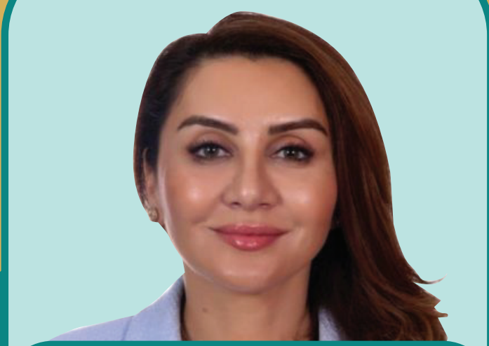
سعادة ناتافان مامادوفا الأمين العام للاتحاد الوطني الأذربيجاني لمنظمات أصحاب العمل ورجال الأعمال

"حضور منتدى مكة للحلال تجربة استثنائية وفريدة، فهو يشكل منصة ترفع التعاون وتبادل المعرفة وبناء القدرات مما يدفع صناعة الحلال نحو مستقبل مستدام."